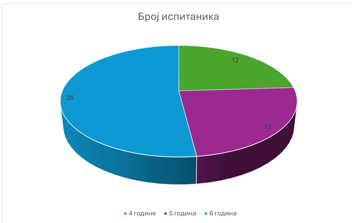
Графикон 2. Подела према узрасту деце

Добијени подаци указују на значај редовног читања и разговора са децом у периоду раног и предшколског развоја. Поред утицаја на развој говора и речника, читање прича доприноси развоју маште, пажње, памћења и комуникације између родитеља и детета, што наративно васпитање чини важним делом васпитно-образовног процеса у раном детињству.